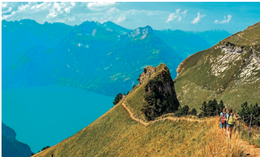
Schmale Bergwege in steilem Gelände können Schwindelgefühle auslösen.

In mulmigen Situationen verändert sich Ihre Atmung, ohne dass es Ihnen bewusst wird. Das bedeutet ein zusätzliches Alarmsignal für den Körper, etwa so: «Mist! Ich könnte hier nicht nur runterfallen, ich könnte hier auch ersti-